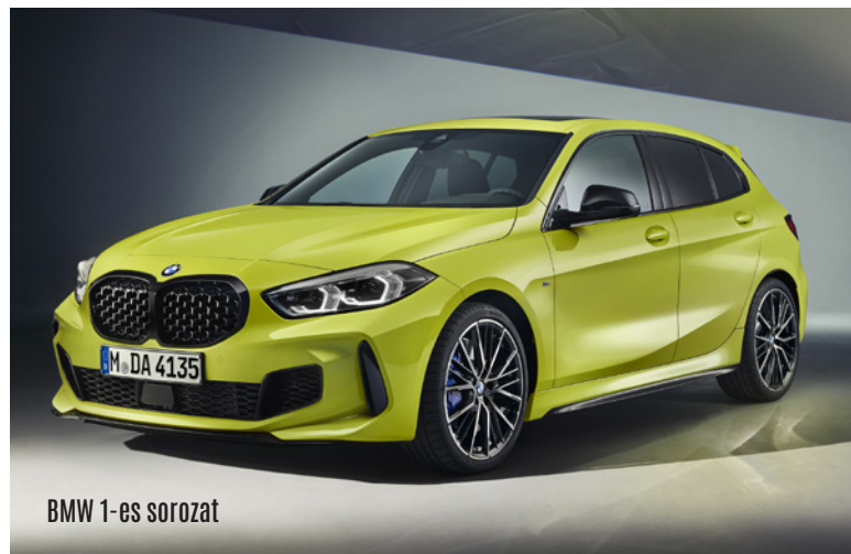
BMW 1-es sorozat

Sajnos negatív csúcstartó is született. A Tesla Model Y a 2026-os TÜV-jelentés szerint a legmagasabb hibaarányt produkálta a vizsgált 2-3 éves autók között, így a megbízhatósági rangsor legvégén végzett. Ez különösen figyelemre méltó, hiszen a Model Y az egyik legnépszerűbb elektromos autó Európában.